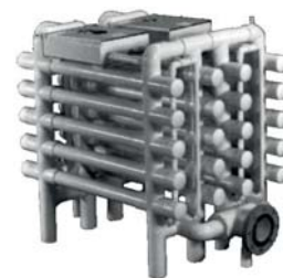
332 GPMus @ 15 000 µWsec/cm 2